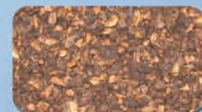
Sansa di olive Olive Husks