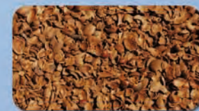
Gusci di mandorle, nocciole e pinoli - Almond, hazelnut and pine shells