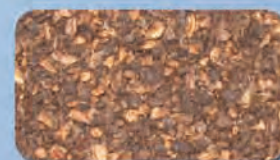
Sansa di olive Olive Husks