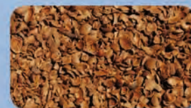
Gusci di mandorle, nocchie e pinoli - Almond, hazelnut and pine shells